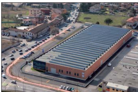
Nuovo centro logistico

Effebi, con un'esperienza ormai quarantennale nell'ambito della produzione di valvole a sfera, ha spaziato in tutti i campi dell'impiantistica civile e industriale, proponendo una vasta gamma di valvole di intercettazione e regolazione sempre più innovative e collaudate. Grazie ad una filiera produttiva totalmente integrata, che comprende l'attenta selezione delle materie prime e lo stampaggio a caldo presso l'azienda consociata Pressytal, supportata da una qualità severamente controllata e certificata secondo la normativa ISO 9001:2000, EFFEBI si è imposta sul mercato italiano ed internazionale come punto di riferimento del settore.